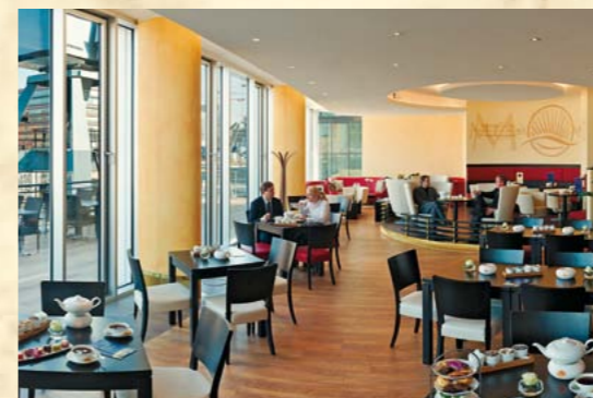
Meßmer MOMENTUM: TeeLounge und Terrasse mit Blick auf die Hamburger HafenCity

Die LSH und ihre Tochtergesellschaften konzipieren zukunftsweisende Vertriebs-, Produkt- und Verpackungskonzepte. Kunden wollen umworben werden. Mit Ideen am Point of Sale, mit bester Qualität oder attraktiven Marken-Erlebniswelten wie beispielsweise dem Meßmer MOMENTUM: Ein inspirierender Ort der Teekreation in der Hamburger HafenCity, der Verbrauchern einzigartige Einblicke in die Welt des Tees und der Marke gibt. Mehr unter: www.messmer-momentum.de .